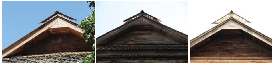
ภาพที่ 18: ยอดจั่วปลายจ่อง เอกลักษณ์สำคัญของเรือนไม้แม่แจ่ม