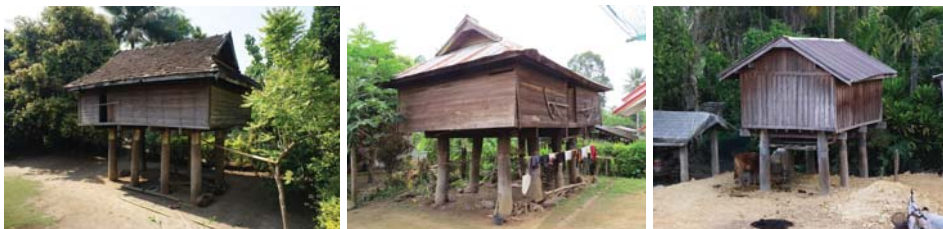
ภาพที่ 4: หลองข้าว

“หลองข้าว” หรือยุ้งข้าว ประเพณีการเลือกตำแหน่งการตั้งหลองข้าวของชาวแม่แจ่มเป็นไปตามประเพณีของชาวล้านนา คือ สร้างเป็นเรือนแยกจากเรือนนอน ตั้งอยู่ชัวงบ้านด้านหน้าบ้าน เข้าถึงง่าย มีขนาดใหญ่ย่อมต่างกันไปตามฐานะของเจ้าเรือน ใช้เสาขนาดใหญ่ทำเป็นคู่ โครงสร้างไม้ขนาดใหญ่เพราะรับน้ำหนักมาก ไม่ทำบันไดทางขึ้น แต่จะใช้เก็น (บันไดลิง) พาดใช้ชั่วคราวแล้วเก็บ เพื่อป้องกันหนูขึ้นไปกัดกินข้าวเปลือก บ้านที่ทำการศึกษาแทบทุกหลังมีและยังใช้งานหลองข้าว แม้บ้านของพ่ออู้อยู่แม่อู้อยู่ (ปู่ย่าตายาย) ผู้สูงอายุที่เลิกทำนาไปแล้ว ที่นาก็ยังมีอยู่ ให้ลูกหลานหรือคนอื่นทำนา เกี่ยวข้าวแล้วจะแบ่งมาให้ ก็จะเก็บไว้ในหลอง แบ่งข้าวเปลือกลงมาครั้งละไม่มากนัก ไปสีที่โรงสีประจำหมู่บ้าน นำข้าวสารมาเก็บไว้ในครัวไฟสำหรับกิน หมดก็แบ่งไปสีอีก ส่วนใหญ่ยังเห็นความจำเป็นของข้าว ไม่มีเงินไม่เป็นไรถ้ายังมีข้าวอยู่ในหลอง แต่ไม่มีข้าวในหลองนี้จะแยเอา สิ่งที่เคยอยู่คู่กับหลองข้าวที่ไม่มีให้เห็นแล้วคือ มองตำข้าว (ครกกระเดื่อง) เพราะเลิกใช้แล้ว หลองเหลืออยู่ที่บ้านพ่ออู้อยู่ก่อนแล้ว อินตะก่อนเพียงแห่งเดียว แต่ก็เก็บไว้เพราะพ่ออู้อยู่ต้องการรักษาไว้เท่านั้น ไม่ได้ใช้งานแล้วเช่นกัน