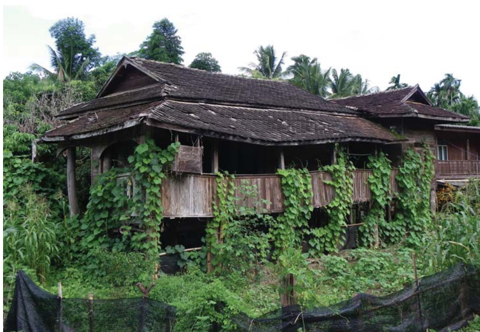
ภาพที่ 24: เรือนไม้แม่แจ่มกำลังจะหมดไป?

ส่วนหนึ่งของปัญหาคือเรื่องรสนิยมและความไม่สอดคล้องกับวิถีชีวิตใหม่ของลูกหลาน ก็มี ส่วนทำให้เรือนไม้เหล่านี้จะหมดไป เมื่อลูกหลานต้องการบ้านสมัยใหม่ ปิดได้มิดชิด ทาสีสวยงาม ดูแล ง่าย มีที่จอดรถ มีห้องส่วนตัว ดังนั้น เมื่อพ่ออยู่แม่อยู่จากไป ลูกหลานก็มักจะรื้อเรือนขายไม้ พ่อค้าไม้ เก่าจากจอมทองและที่อื่นๆ คอยรับซื้อและขนย้ายไม้ออกนอกพื้นที่ ลูกหลานก็ปลูกเรือนแบบสมัยใหม่ ด้วยอิฐด้วยปูนทดแทน ที่สุดแล้ว ก็จะไม่เหลือเอือนบะเก่าล้านนาเอกลักษณ์แม่แจ่มให้เห็นให้ชื่นชม ได้อีกต่อไป