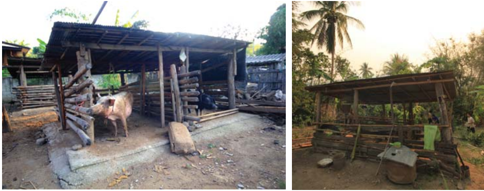
ภาพที่ 8: ฝามเลี้ยงสัตว์