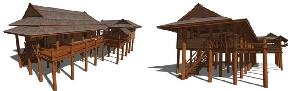
ภาพที่ 14: ภาพจากแบบ 3 มิติ เฮือนบะเก่าจั่วเดี่ยว หรือ เฮือนบะเก่าจั่วเดี่ยว เรือนพ่อวรรณ บ้านเหล่า (เรือลงแล้ว มกราคม 2554)