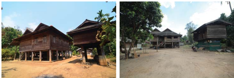
ภาพที่ 3: ชัวงบ้าน