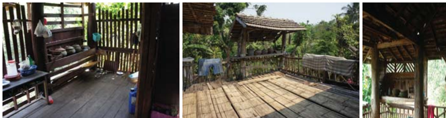
ภาพที่ 19: บ้านน้ำ

“ราวระเบียง” หรือราวกันตก ทำด้วยไม้สัก หลายขนาดและรูปแบบต่างๆ กัน ได้แก่