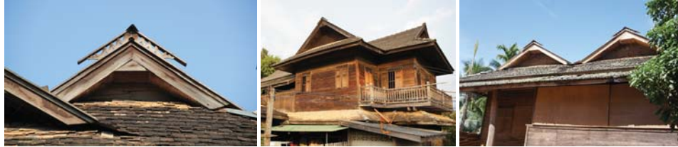
ภาพที่ 17: หลังคาเรือนไม้แม่แจ่ม