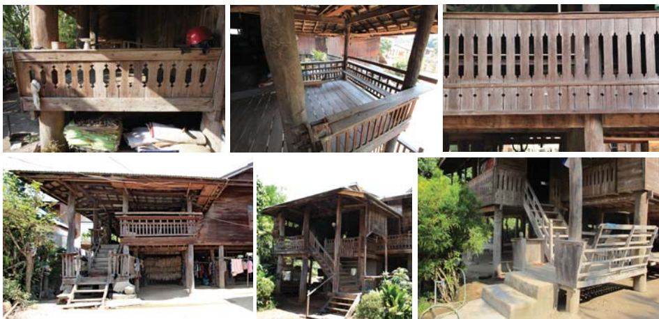
ภาพที่ 20: ราวระเบียงแบบต่างๆ (บน) บันไดทางขึ้นเรือน (ล่าง)

หน้าต่างเรือน อัญลุน สนธิคุณ บ้านต้นตาลนางแล