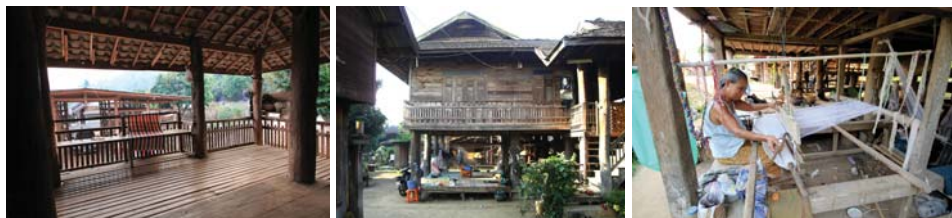
ภาพที่ 16: ขานบันไดและเต็น (ซ้าย) พื้นที่ใช้งานใต้ถุนเรือน (กลาง/ขวา)

เดิมใต้ถุนนี้จะไม่ทำพื้น ปล่อยให้พื้นดิน ปรับเรียบกดอัดแน่น ปัจจุบันหลายหลังเทพื้นคอนกรีตเต็มพื้นที่ให้ใช้งานได้ดีขึ้น หรือทำไปพร้อมกับการแก้ไขปัญหาดินเสาไม้และเรือนทรุด ปัจจุบันมีการใช้งานใต้ถุนมากขึ้นมาก บางหลังใช้เป็นที่จอดรถหรือมอเตอร์ไซด์ หลังที่ต่อเติมห้องส่วนใหญ่มักใช้เป็นห้องเก็บของ แต่บางหลังก็เป็นห้องอื่นๆ หรือแม้แต่เป็นห้องนอน