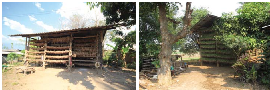
ภาพที่ 11: โฮงหอม

“ครัวไฟ” บ้านหลายหลังไม่ทำครัวบนเรือนแล้ว บอกว่ามันทำให้เรือนสกปรก ฝาและหลังคาดำเพราะควัน จึงย้ายครัวไฟลงมาปลูกเป็นเรือนแยก เป็นเรือนชั้นเดียว ทำติดดินไม่ยกพื้น นอกจากครัวไฟไว้ปรุงอาหารแล้ว ยังมี “ตูบไฟ” ทำเป็นเพิงง่ายๆขนาดเล็ก ไว้ใช้สำหรับเตาฟืน ซึ่งชาวแม่แจ่มยังคงใช้กันอยู่มาก เพราะสวนหลังบ้านหรือป่าชุมชนยังมีกิ่งไม้แห้งอีกมาก ฟืนพวกนี้ไม่ต้องซื้อ เพียงออกแรงตัดมาเลื่อยมาก็มีพลังงานให้ใช้ได้ แม้จะมีเตาแก๊สใช้กันแล้วในปัจจุบัน เตาฟืนมีควันมาก จึงแยกออกมาจากครัวไฟ เตาฟืนในตูบไฟนี้ ก่อฟืนครั้งหนึ่งจะใช้จนฟืนไหม้หมด ตั้งแต่ หนึ่งข้าว ต้มน้ำ ต้มถั่วเน่า ฯลฯ บางหลังไม่ทำตูบไฟ แต่ใช้พื้นที่ใต้หลังคา หรือใต้ชายคาของครัวไฟเป็นที่ตั้งของเตาฟืน