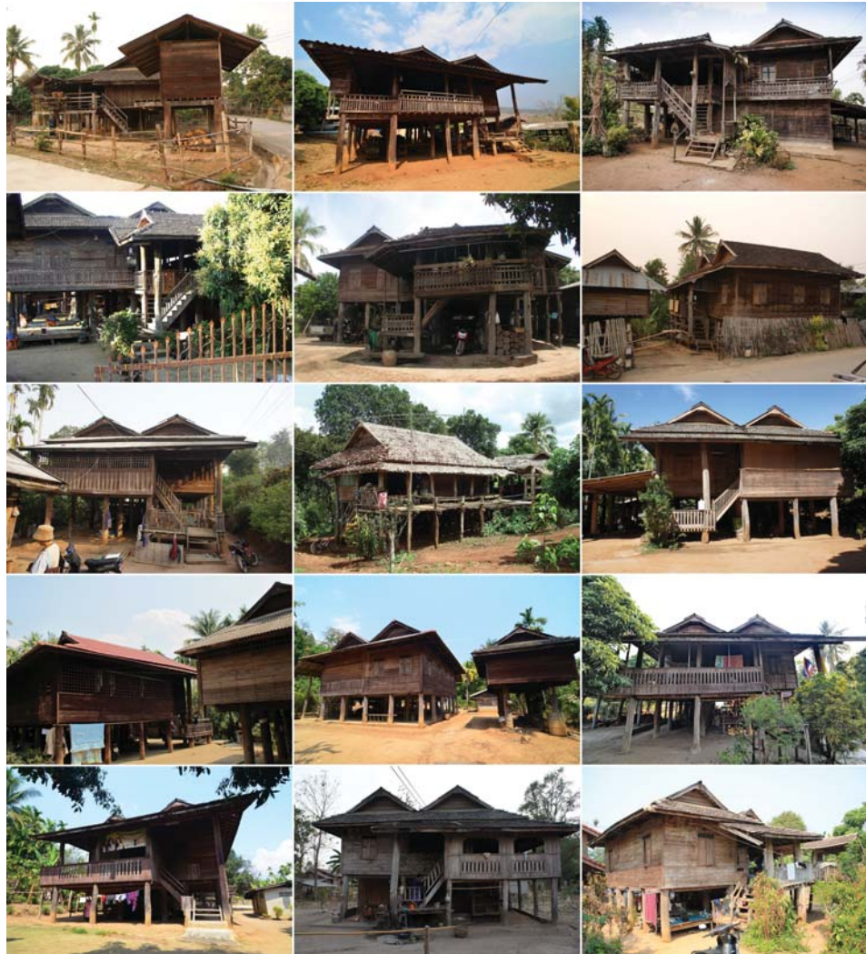
ภาพที่ 13: ตัวอย่างเฮือนบะเก่าแม่แจ่ม