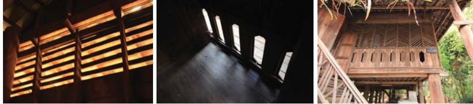
ภาพที่ 21: ช่องลม