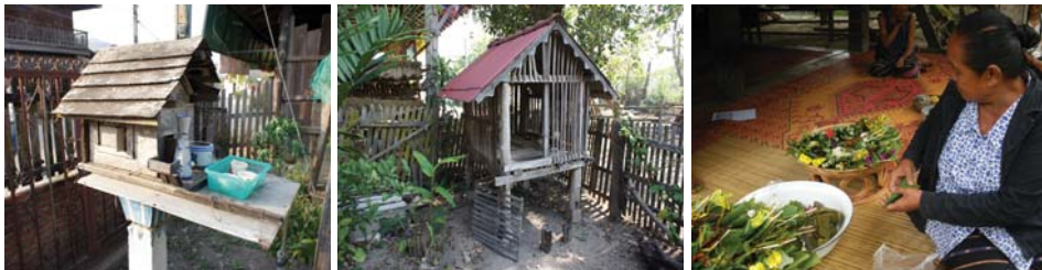
ภาพที่ 9: พระภูมิเจ้าที่ (ซ้าย) ดุบผี (กลาง) ลูกหลานในสายผีมาหอมสวดยดอกที่บ้านเก่า (ขวา)