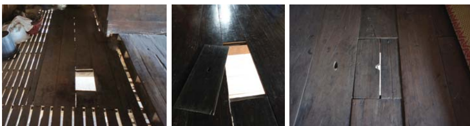
ภาพที่ 6: “ฮูรื่อง” ช่องสำหรับผู้ขับถ่ายตอนกลางคืน

“พืชพันธุ์และสวนครัว” บริเวณช่วงบ้าน จะมี “สวนบันได” (สวนริมบันไดทางขึ้นด้านหน้า) ปลูกต้นโกศและดอกไม้สำหรับบูชาพระ ประดับผม อาศัยน้ำจากน้ำล้างเท้า มีสวนน้ำบ่อ มีสวนครัว ข้างบ้านหรือหลังบ้าน บางบ้านที่มีไก่อ ก็จะทำ “ฮูรื่อง” (รั้วฮู) ล้อมไว้กันไกจิกกิน เช่นเดียวกับบ้าน ล้านหน้าทั่วไป และสวนหลังบ้าน มักเป็นสวนกล้วย ผลไม้ ต้นหมาก ต้นมะพร้าว ต้นไผ่ ฯลฯ ส่วนใหญ่ จะปลูกไม้ที่ใช้ประโยชน์โดยตรง เช่น เป็นช่างจักสานก็จะปลูกไผ่ ปลูกกล้วยเพื่อเก็บใบตองไปขาย ปลูกหมากปลูกผลไม้ไว้กิน เป็นต้น