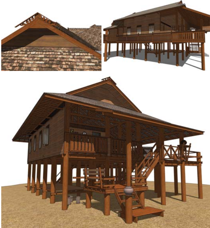
ภาพที่ 23: เอกลักษณ์เรือนไม้ที่แม่แจ่ม

94 หน้าจั่ว: ว่าด้วยสถาปัตยกรรม การออกแบบ และสภาพแวดล้อม วารสารวิชาการ คณะสถาปัตยกรรมศาสตร์ มหาวิทยาลัยศิลปากร