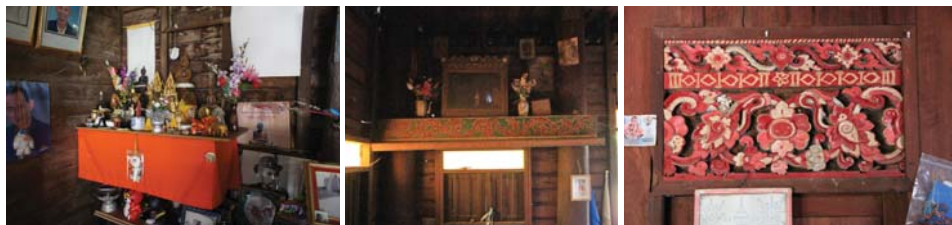
ภาพที่ 22: องค์ประกอบด้านความเชื่อบนเรือนแบบประเพณี

“หิ้งพระ หิ้งผี ภาพประดับ” บริเวณเต็นของเรือนแบบประเพณี จะพบการบูชาและการประดับประดาที่เหมือนกัน ประกอบด้วย หิ้งพระ รูปถ่ายพระสงฆ์ พระบรมฉายาลักษณ์ รูปถ่ายบรรพบุรุษ รูปถ่ายบุคคลในครอบครัว ทั้งที่เสียชีวิตไปแล้วและที่ยังอยู่ ตลอดจนรูปภาพของความภูมิใจของลูกหลาน เช่น รูปถ่ายรับพระราชทานปริญญาบัตร สำเนาปริญญาบัตร ประกาศนียบัตร หรือใบประกาศเกียรติคุณต่างๆ ส่วนหิ้งผีจะอยู่ในห้องนอน เป็นที่เก็บอัฐิหรือรูปบูชาของบรรพบุรุษ