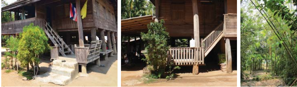
ภาพที่ 7: สวนบันได และสวนป่าหลังบ้าน