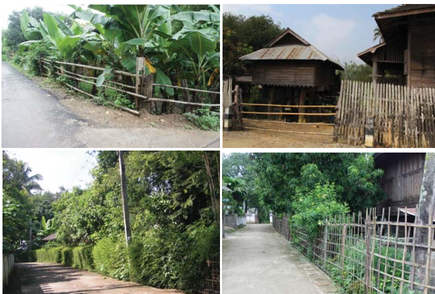
ภาพที่ 1: รั้วบ้านในแม่แจ่ม

“ฮั่วบ้าน” หรือรั้วบ้าน สร้างขึ้นเพียงเพื่อแสดงอาณาเขตมากกว่าเพื่อป้องกันภัยจากโจรผู้ร้าย เพราะการอยู่ในหมู่บ้านที่รู้จักกัน และอยู่ในกลุ่มเครือญาติ รวมทั้งเป็น “คนมีศีล” (คนที่มีศีลธรรม มีกิริยาดี) รั้วจึงสร้างขึ้นง่ายด้วยรูปแบบแบบประเพณีล้านนาดั้งเดิม ประกอบด้วย “ฮั่วตาแสง” (รั้วตาแสง) ทำจากไม้ไผ่ผ่าซีกสานขัดเป็นตารางห่างๆ “ฮั่วสะลาบ” (รั้วสะลาบ) ทำจากไม้ไผ่ผ่าซีกขัดแตะถี่ๆ “ฮั่วคาวหรือฮั่วตั้งป่อง” (รั้วคาว รั้วตั้งป่อง) ทำจากไม้รวกขนาดเล็กสามถึงสี่ท่อนเรียงกันผ่านรูที่เจาะเสาปักไม้หรือไม้ซางใหญ่ และ “รั้วต้นไม้” ใช้การปลูกต้นไม้พุ่มประเภทชาปลูกเป็นแนวและตัดให้เป็นแนวแทนรั้ว รั้วเหล่านี้ ทำได้โดยไม่ต้องใช้ตะปู ถูกดัดแปลงเมื่อมีตะปูใช้กันแพร่หลาย รั้วไม้สะลาบก็ไม่ขัดกันแล้ว ใช้ตะปุดอกยึดแทน รั้วคาวก็ไม่เจาะรูเสาแล้ว ใช้ตะปุดอกไม้รวกยึดกับเสาแทน นอกจากนี้ ยังพบ “รั้วไม้จริงตีตั้งเว้นร่อง” ซึ่งไม่ได้เป็นแบบประเพณีดั้งเดิมของล้านนา เกิดขึ้นในยุคใช้ตะปู แต่ก็ถูกกลมกลืน ไม่ทำให้เสียบรรยากาศเรือนพื้นถิ่นล้านนา รั้วแบบนี้นิยมใช้กันมากในแม่แจ่ม พบเห็นได้ทั่วไป