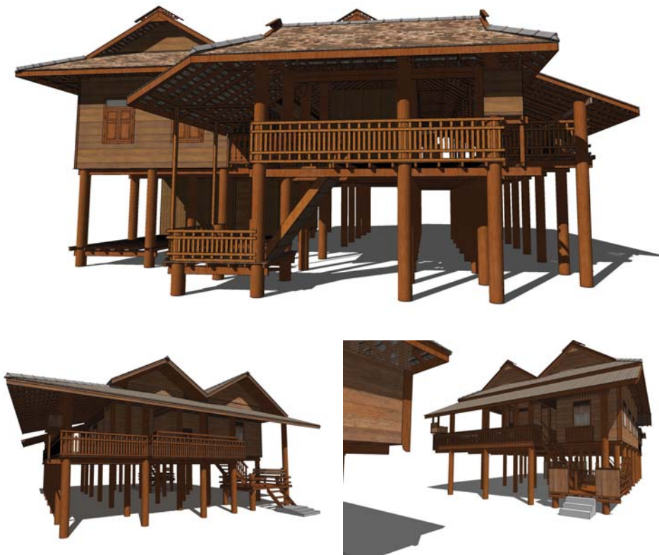
ภาพที่ 12: ภาพจากแบบ 3 มิติ เฮือนบะเก่าจั่วแฝด หรือ เฮือนสองจ่อง (บน) เรือนฮุยแก้ว บ้านพร้าวห่ม (ล่างซ้าย) เรือนฮุยดำคำ บ้านต้นตาล (ล่างขวา) เรือนฮุยใจ บ้านนาเรือน

“เฮือนบะเก่าจั่วเดี่ยว” หรือ “เฮือนจ่องเดี่ยว” ลักษณะเป็นเรือนแบบเดียวกับเฮือนจั่วแฝด มีองค์ประกอบต่างๆของเรือนเหมือนกัน ต่างกันที่เป็นเรือนที่ใช้หลังคาจั่วเดี่ยว เพราะมีขนาดเล็กกว่า หรือมีห้องเพียงห้องเดียว หรือเป็นเรือนรุ่นหลัง มีกระเบื้องลอนให้เลือกใช้ สามารถทำหลังคาที่ลาดเอียงน้อยกว่ากระเบื้องดินขอหรือกระเบื้องคอนกรีตแบบเดิมได้ จึงทำเป็นจั่วเดี่ยวคลุมเรือนที่มีผังพื้นแบบเรือนแฝดได้ทั้งหมด