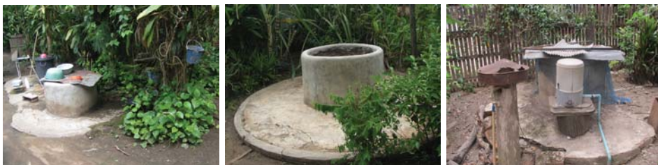
ภาพที่ 5: น้ำบ่อ

ต่อเติมห้องน้ำที่บนเรือนด้านหลังติดกับครัวไฟ เพื่อความสะดวกในการใช้งาน หลายหลังยังมี “ฮูรื่อง” ช่องเปิดใต้พื้นสำหรับผู้สูงอายุและเด็กใช้ขับถ่ายตอนกลางคืน