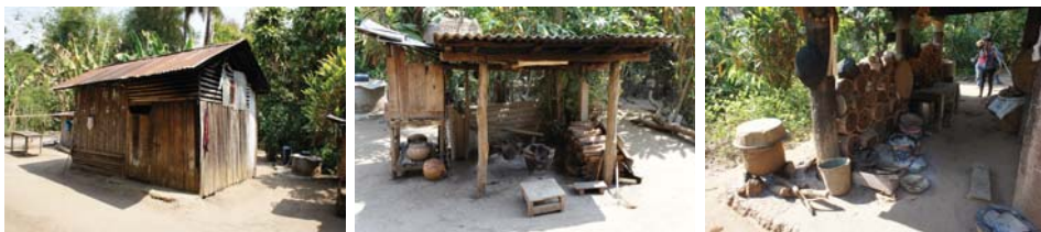
ภาพที่ 10: ครวไฟ (ซ้าย) ดุบไฟ (กลาง) ใต้หลองข้าว (ขวา)