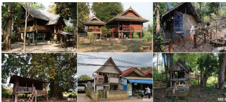
ภาพที่ 5: สถานที่ศักดิ์สิทธิ์