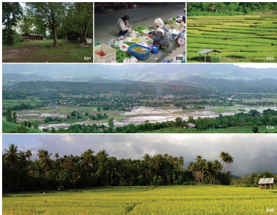
ภาพที่ 8: แหล่งอื่นๆ