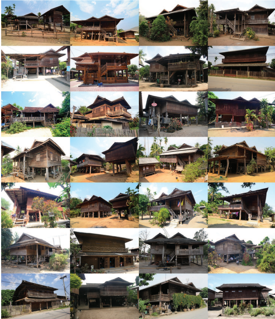
ภาพที่ 4: ร้านค้าและเคหสถาน