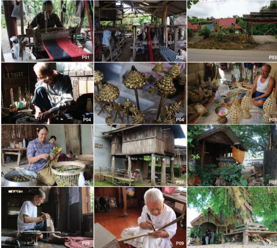
ภาพที่ 6: แหล่งภูมิปัญญาท้องถิ่น