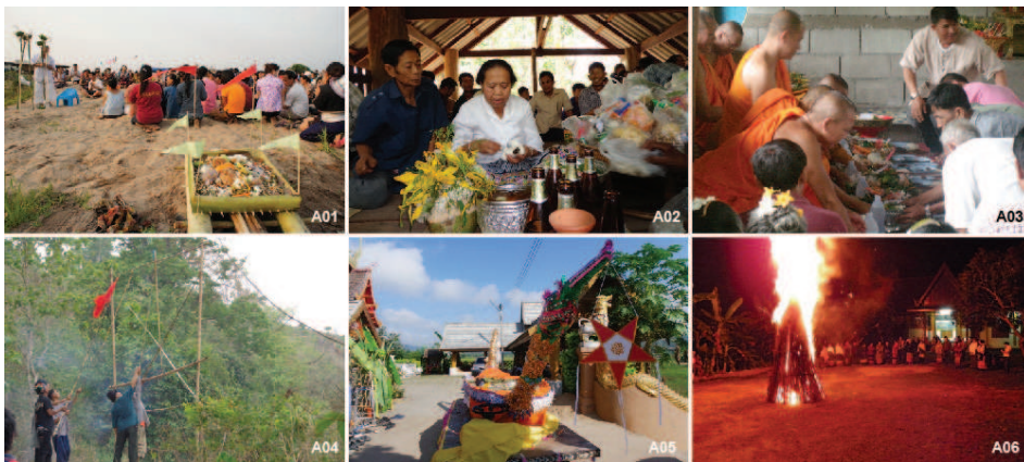
ภาพที่ 7: แหล่งพิธีกรรม