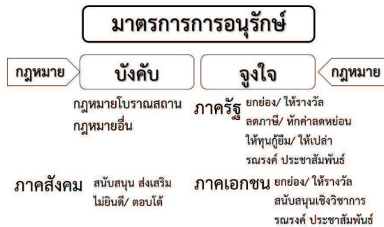
ภาพที่ 9: มาตรการการอนุรักษ์

การพัฒนาเมืองแม่แจ่ม ชุมชน และสังคมภายใต้กรอบแห่งการอนุรักษ์ เป็นสิ่งที่ควรตระหนัก ในพื้นที่เมืองแม่แจ่มที่มีมรดกทางวัฒนธรรมที่มีคุณค่า จึงจำเป็นต้องมีเครื่องมือที่เหมาะสม เพื่อไม่ ให้การพัฒนาทำลายคุณค่ามรดกทางวัฒนธรรม การพัฒนาเมืองเพื่อการอนุรักษ์นั้นไม่สามารถ ทำได้เพียงภาครัฐ ต้องอาศัยการยอมรับและความร่วมมือจากคนในพื้นที่ด้วย เพราะส่วนใหญ่เป็น พื้นที่และอาคารของประชาชนและวัด จึงต้องทำความเข้าใจและสร้างสำนึกควบคู่ไปกับการบังคับใช้ กฎระเบียบต่างๆ มาตรการอนุรักษ์ แบ่งได้เป็น 2 ประเภท คือ มาตรการบังคับ และมาตรการจูงใจ ซึ่งทำได้ทั้งภาครัฐ ภาคเอกชน ภาคประชาชน