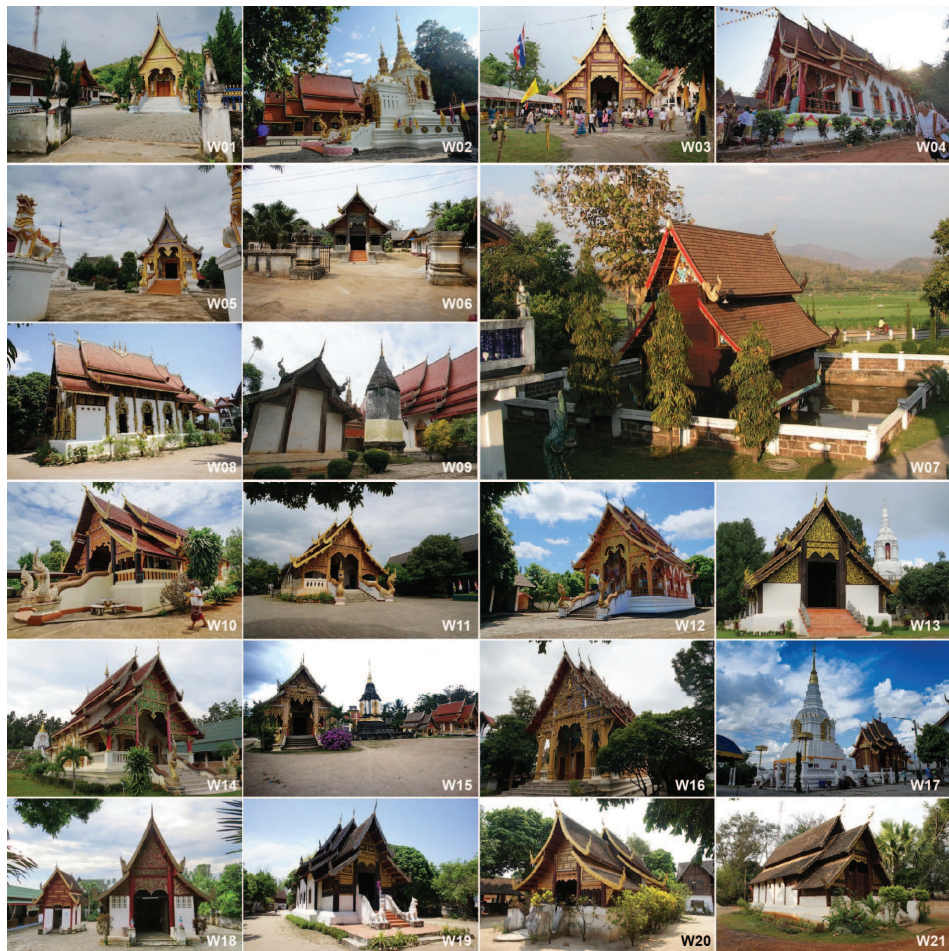
ภาพที่ 3: วัดในเมืองแม่แจ่ม