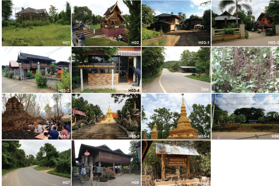
ภาพที่ 2: แหล่งประวัติศาสตร์เมืองแม่แจ่ม